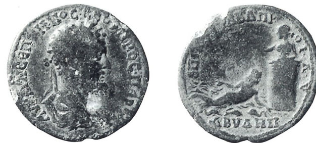
D'après Geld uit de grond , p. 61.